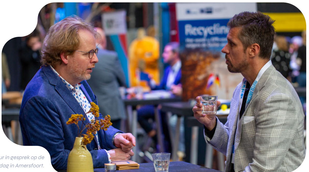
EEN-adviseur in gesprek op de Duitsland-dag in Amersfoort.

Project EEN (Enterprise Europe Network) heeft als doelstelling om bedrijven uit de provincie Utrecht te helpen met internationale ambities, zoals het vinden van zakenpartners, participeren aan handelsmissies, matchmaking events en adviezen/support bij het zetten van eerste stappen richting het buitenland.